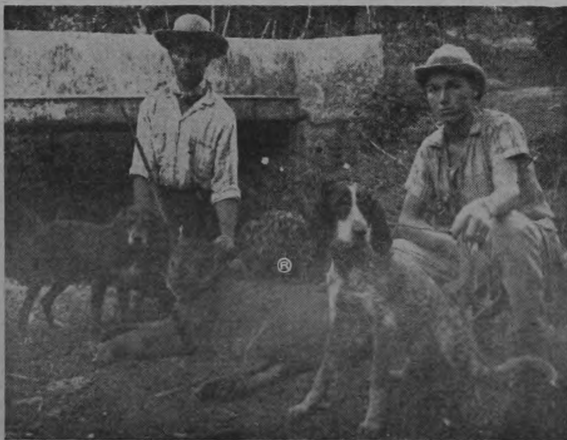
He aquí los vecinos de San Rafael, aficionados a la cacería que se enfrentaron y dieron muerte con rifle casero a un peligroso león-tigre de 160 libras. El hermoso y enorme animal parece que posa con gusto entre sus valientes rivales, satisfecho de haber sido vencido por verdaderos hombres. También la cámara presenta a los perros que se fajaron como los buenos.