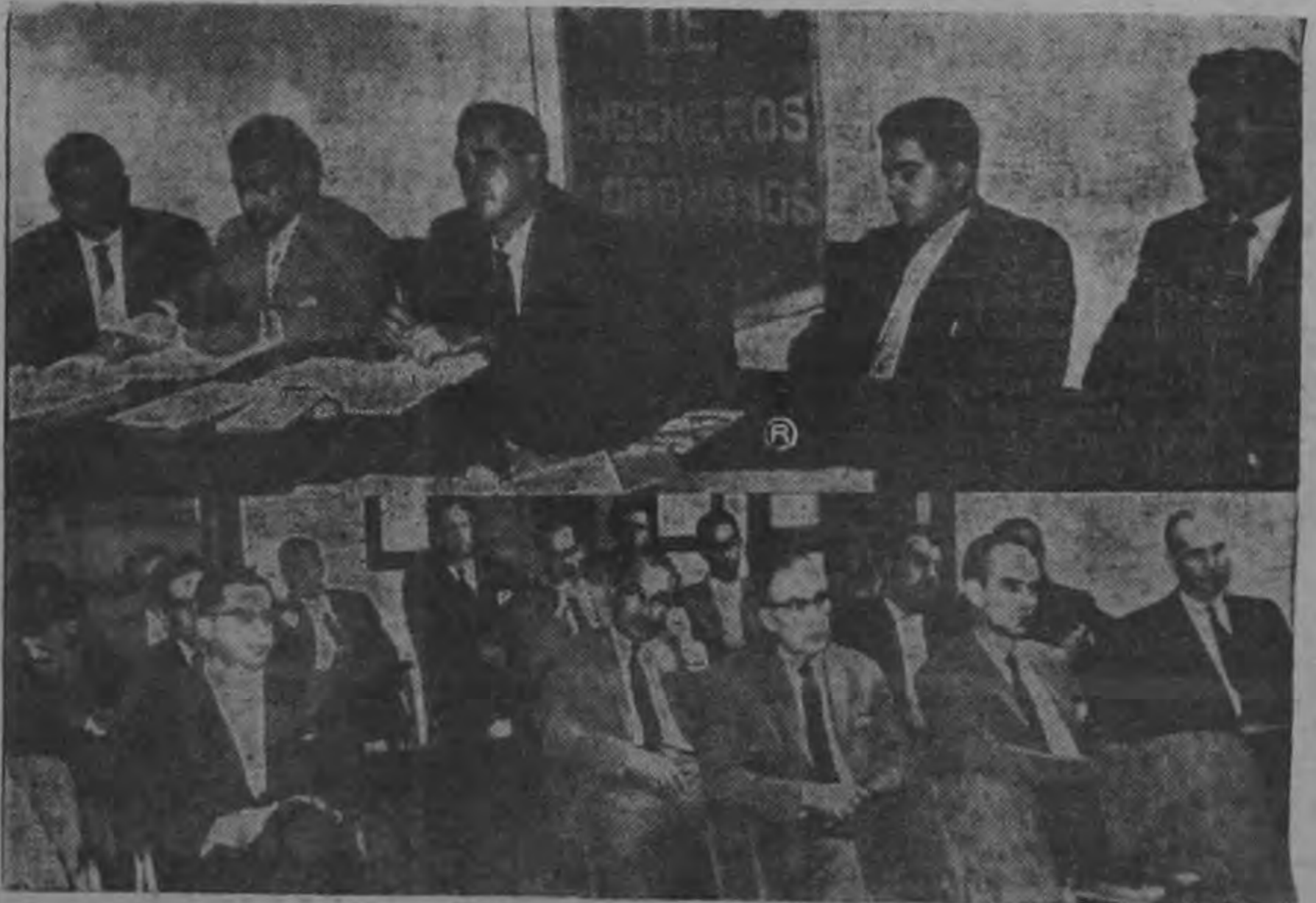
Conforme estaba prevista, ayer en el edificio del Colegio de Ingenieros Agrónomos, se reunió el Comité Nacional con el propósito de continuar los preparativos del programa que habría de llevarse a efecto en la Duodécima Semana Nacional de Conservación de Recursos Naturales, del 11 al 17 de junio próximo.— En la gráfica, los miembros del Comité y asistentes al acto, que se prolongó por varias horas.