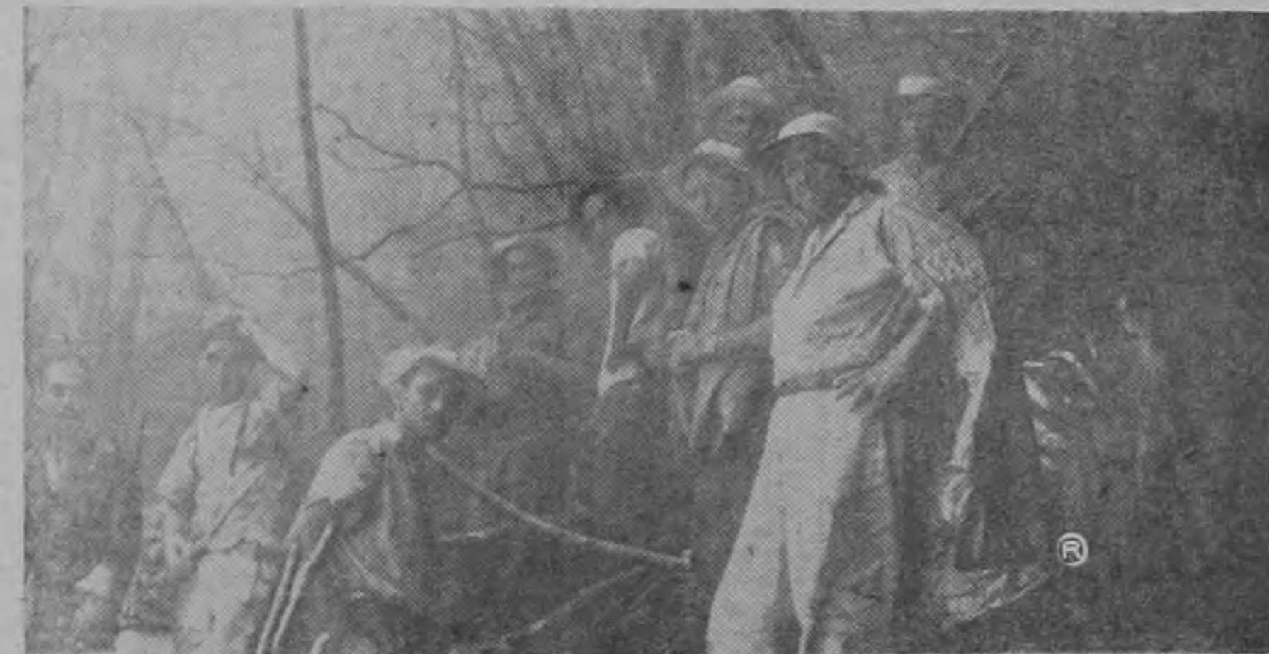
TIEMPO INFERNAL. Los expedicionarios hacen un alto en las labores para descansar unos, tomar café otros y fumarse un cigarrillo los más. La fotografía fue tomada durante uno de los cortísimos lapsos en que la niebla se desvaneció un poco. Los expedicionarios dicen que estuvieron horas y horas sufriendo intensos aguaceros que les calaron hasta los huesos.