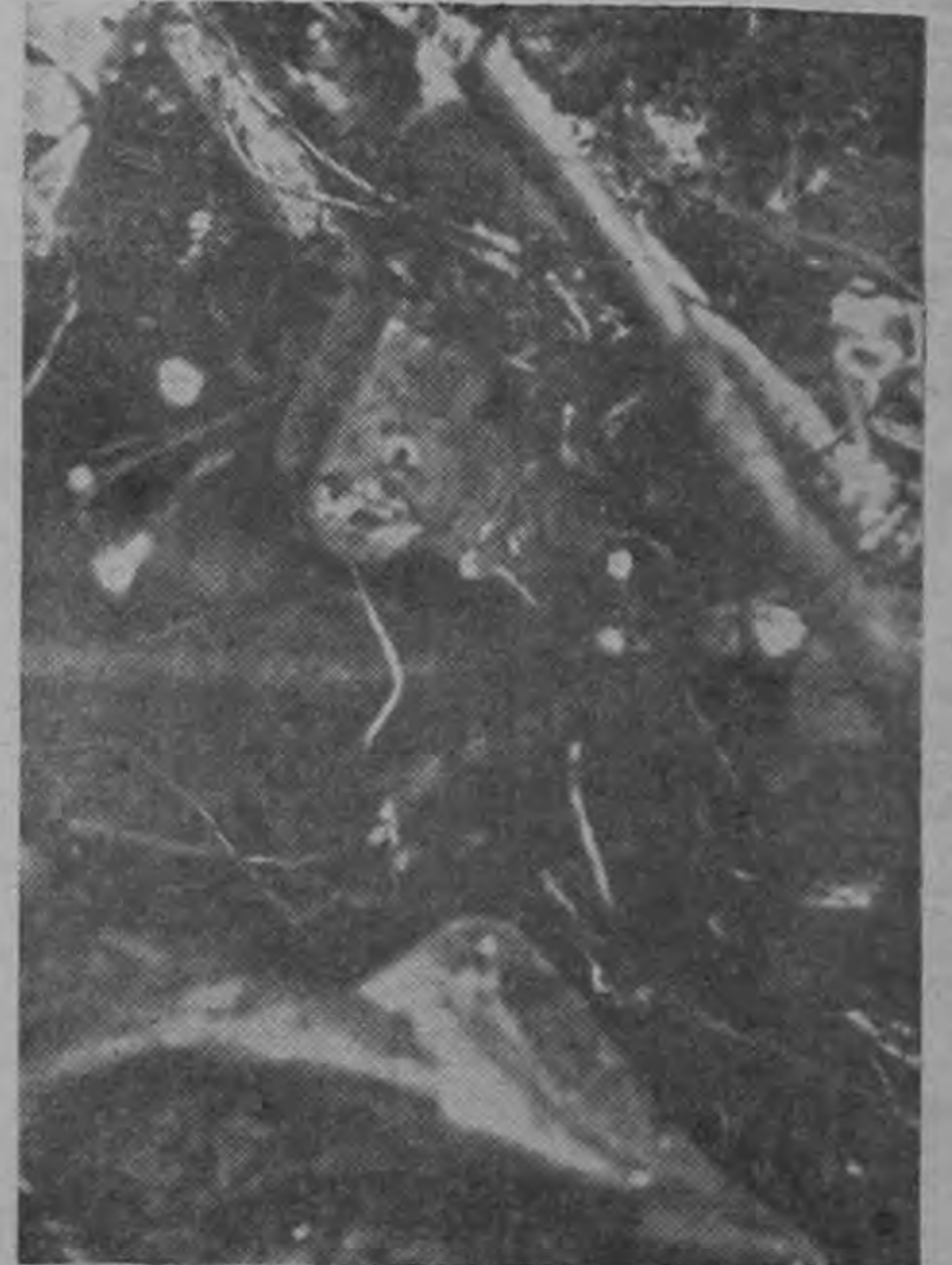
LOS ACELERADORES del Douglas estaban también a considerable distancia. Estas pequeñas palancas que sirven para dar gas a los motores están inmediatamente al lado derecho del piloto. En los pedazos del 1006 aparecieron a 30 metros de donde estaban los restos de cabina.