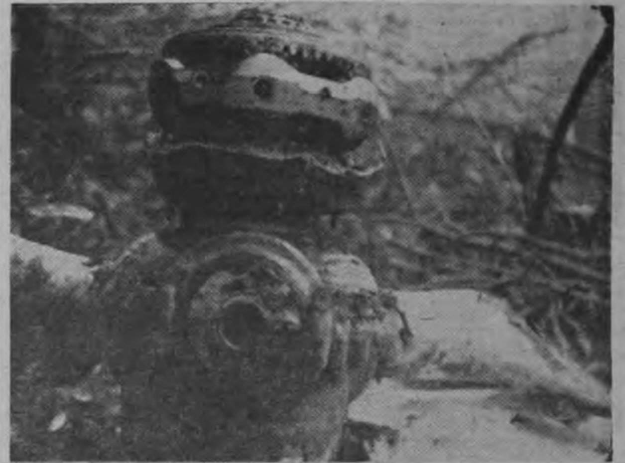
PEDAZOS DE HELICE. La gráfica muestra una de las hélices. El agujero que se ve al centro abajo es la base de una de las palas. Es aluminio sólido con un vacío de poca dimensión. La base del aspa tiene unas tres pulgadas de grueso. Sin embargo, el golpe la cercenó como si fuese una cucharilla cafetera. El mecanismo de arriba es el que hace variar el ángulo de las hélices en vuelo, pero todo está normalmente cubierto con un capicete de acero de un cuarto de pulgada. Este desapareció cercenado de raíz.